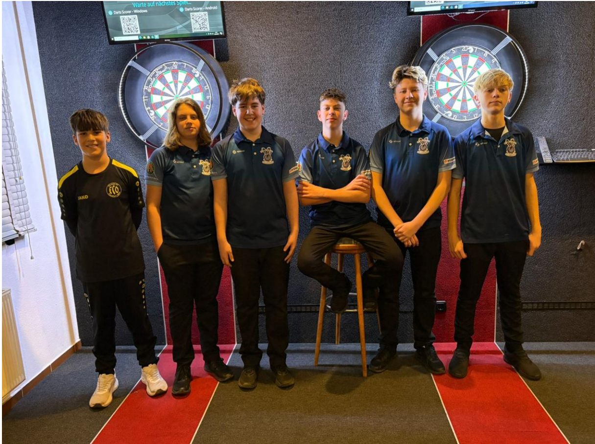
Mannschaftsfoto vom vergangenen Spieltag (14.03.2026) der Saison